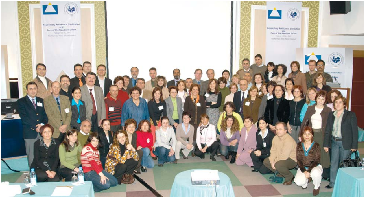
IPOKRATES ve Türk Neonatoloji Derneği ile işbirliği ile düzenlenen "Respiratory Assistance, Ventilation and Care of the Newborn Infant" kursuna katılanlar, 22-24 Şubat 2007, İstanbul