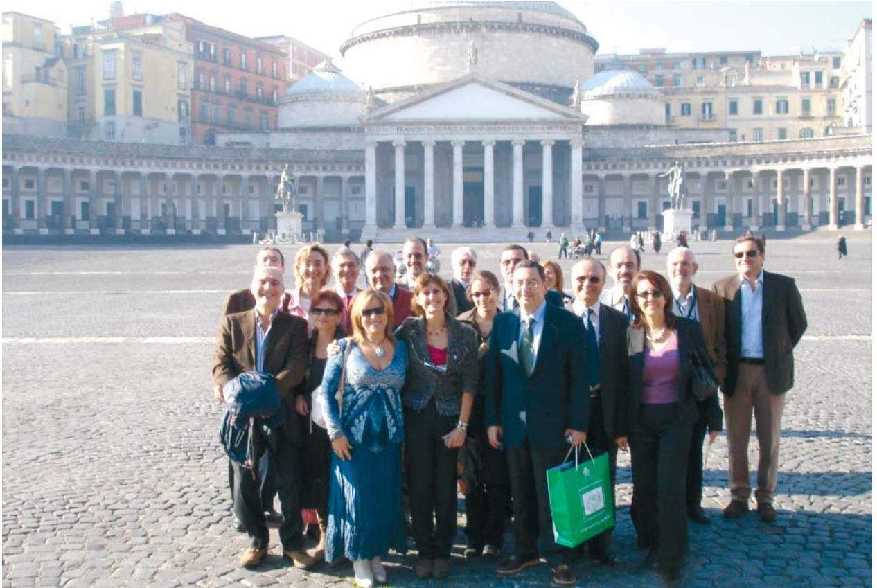
MANO'nun (The Mediterranean Association for Neonatology Observatory) ilk uluslararası toplantısına katılanlar, 26 Kasım 2006, Napoli