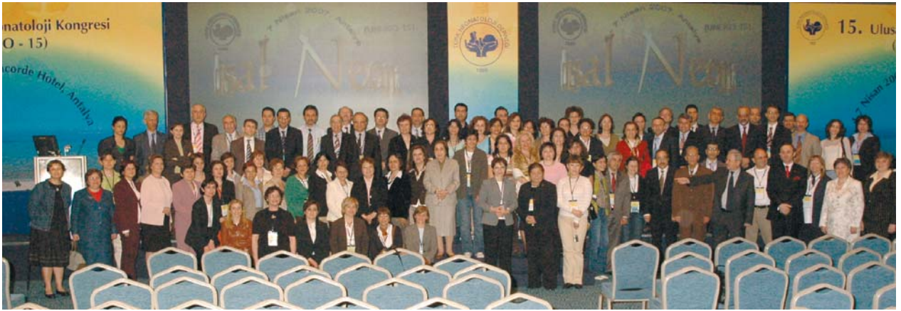
15. Ulusal Neonatoloji Kongresi Kapanış Töreni'nden

Kongre Türk Neonatoloji Derneği Genel Kurul Toplantısı ile sona erdi.