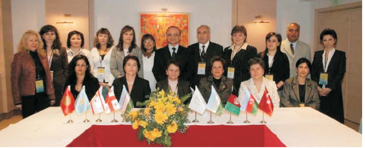
ICENS'in Kuruluş Belgesi imzalandıktan sonra Kurucu Üyeler, Türk Neonatoloji Derneği Yönetim Kurulu Üyeleri ile birlikte

Daha sonra Birliğin Yönetim Organları'nın seçimine geçildi. Yönetim Kurulu üyeleri oy birliği ile belirlendikten sonra her ülke temsilcisi Konsey için açık bulunan adlar için önerilerde bulunuldu ve ilk Konsey (Council of Delegates) oluşturuldu.