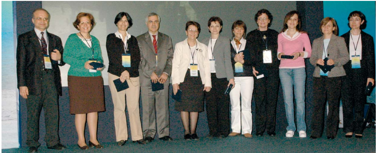
Kongre Düzenleme Kurulu